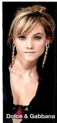
Dolce & Gabbana

1. IRIDESCENTE Cipria Poudre Nacrée, Bobbi Brown (38.000). 2. VELLUTATA Terra Poudre Infinie n°511, Rochas (52.000). 3. IMPALPABILE Cipria Powder Brush, Pikenz The First (36.000). 4. PERLATA Skinlights Face Illuminator Lotion, Revlon (39.000).