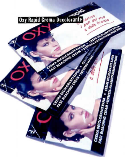
Oxy Rapid Crema Decolorante