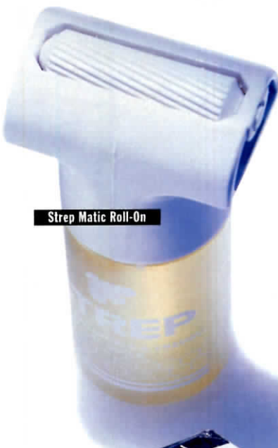
Strep Matic Roll-On