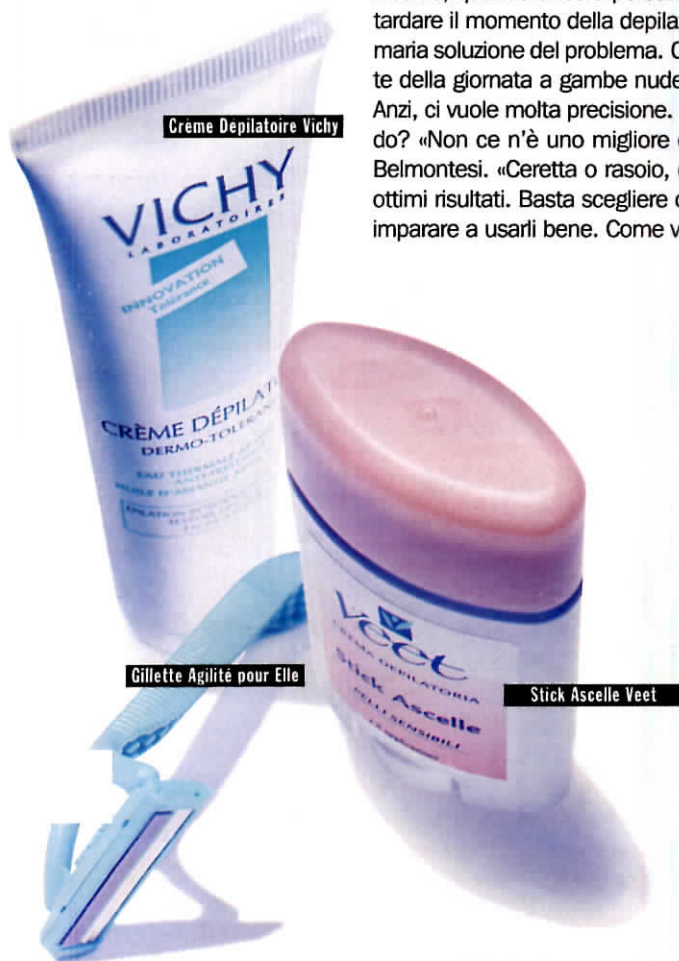
Crème Dépilatoire Vichy