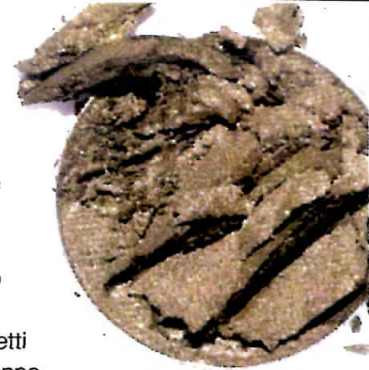
Ombretto Earth Spirits Smokey Gold di Max Factor.