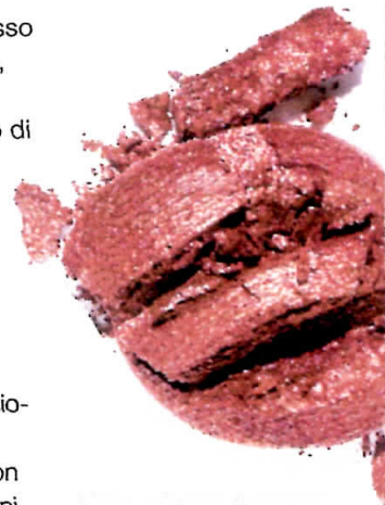
Polvere di Stelle n.06 Linea Mediterranea Make up di F.lli Carli.