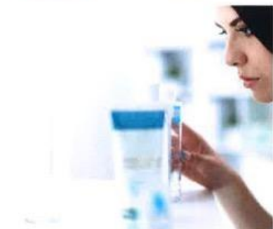
FARMACOLOGIA La cosmetovigilanza