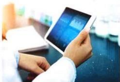
PARLIAMONE Scenari post Ddl