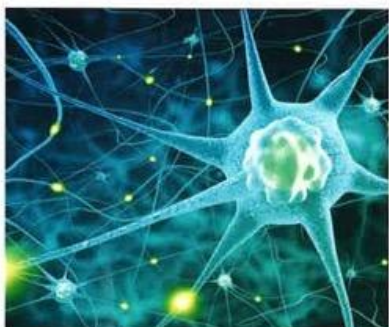
MEDICINA Prevenzione in neurologia