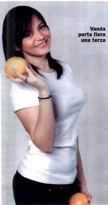
Vanda porta fiera una terza

«Quando il seno è abbastanza voluminoso, uno dei pericoli principali sono le smagliature», spiega Di Pietro. «Le taglie prosperose rischiano di più, sia perché possono svuotarsi maggiormente, sia perché un seno più grande è anche più pesante e tende a rilassarsi». Facci attenzione: le strie si dispongono a raggiera intorno al capezzolo, perché le fibre interne si lacerano perpendicolarmente al senso di maggiore tensione della pelle. Cosa si può fare? «Oltre a evitare eccessivi sbalzi di peso, per rendere meno visibili le smagliature si